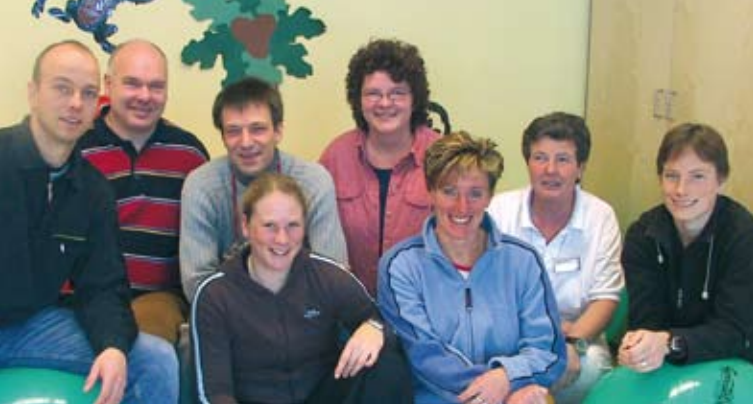
Das interdisziplinäre Asthmateam der Fachklinik Gaißach.